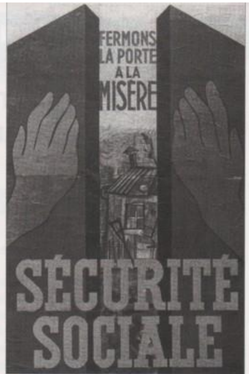
4 La création de la Sécurité sociale Affiche, 1945.

■ Extraits du préambule de la Constitution de 1946.