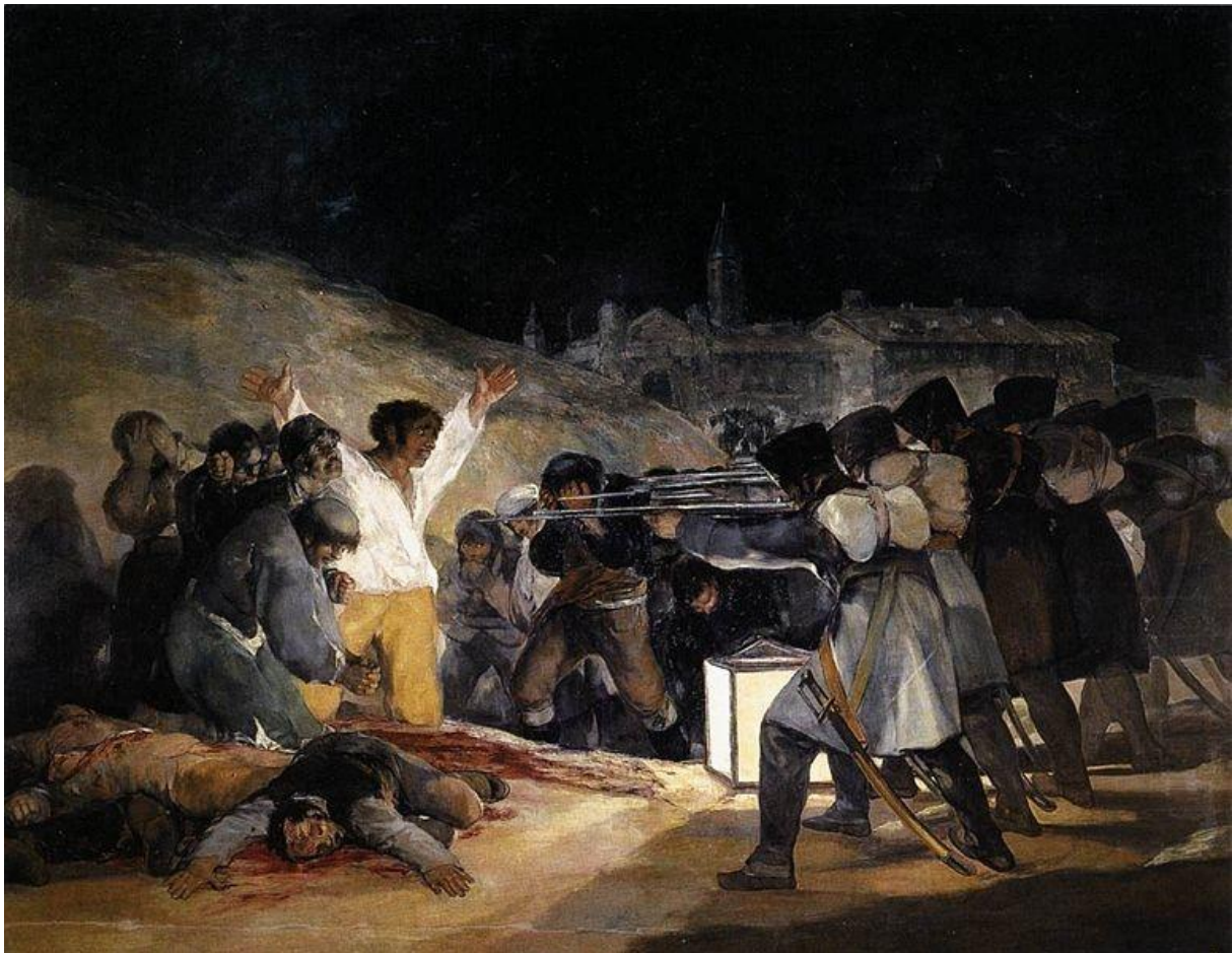
Le Tres de Mayo (Goya), 1814